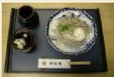
写真:おろしそばと、 そばがきぜんざい

本格手打ちそばメニュー（せいろそば¥700、おろしそば¥900、鴨せいろ¥1000、そばがきぜんざい¥300ほか）。清流古座川を眺めながらおそばをどうぞ。Pあり。