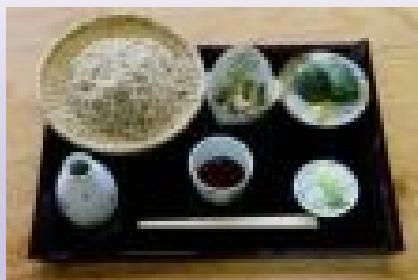
写真:めはりセット (せいろそば、季節山菜小鉢、めはり寿司)

本格手打ちそばメニュー（せいろそば¥700、めはりセット¥1000）。桜の名所、七川ダム湖の緑豊かなパノラマ風景を眺めながら大広間でゆっくりと味わうおそばは格別です。Pあり。